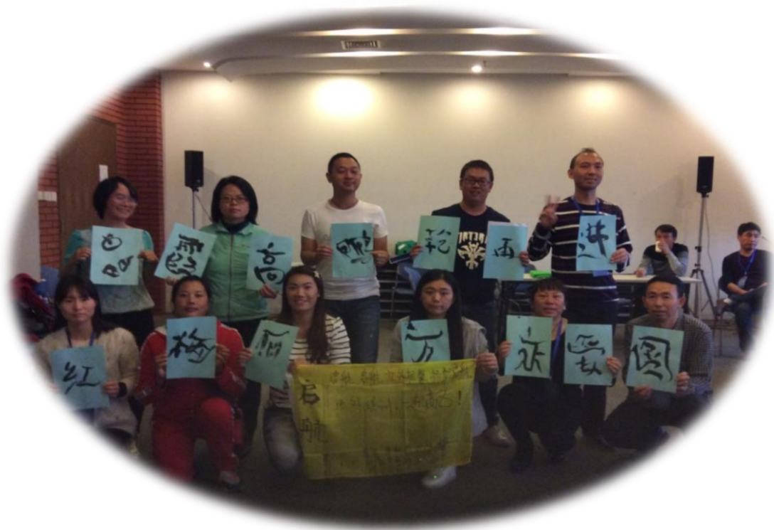
启航队员协力书写的“藏名诗”